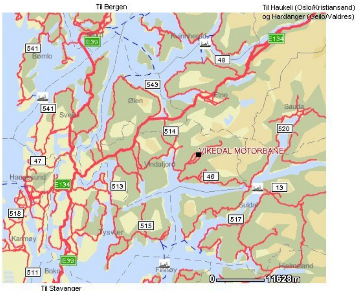
Kart frå visveg.vegvesen.no

Vikedal Motorbane ligg i Vikedal i Vindafjord kommune, midt mellom Haugesund og Sauda. Enklaste veg for dei som kjem nordfrå Bergen eller sørfrå Stavanger er å følgja E39 til Våg i Tysvær og følgja E134 mot Oslo til Knapphus. Ta til høgre inn på Rv. 46 og følg denne til Vikedal sentrum. Derfrå er det skilta til "Motorbanen". Dei som kjem over Haukeli følgjer E134 mot Haugesund til Ølen, tar av til venstre på Rv. 514 til Sandeid og fortset på Rv. 46 til Vikedal. Dei som kjem over Hardangervidda følgjer Rv. 13 forbi Odda til Skare og fortset på E134 mot Haugesund til Ølen, tar av til venstre på Rv. 514 til Sandeid og fortset på Rv. 46 til Vikedal.